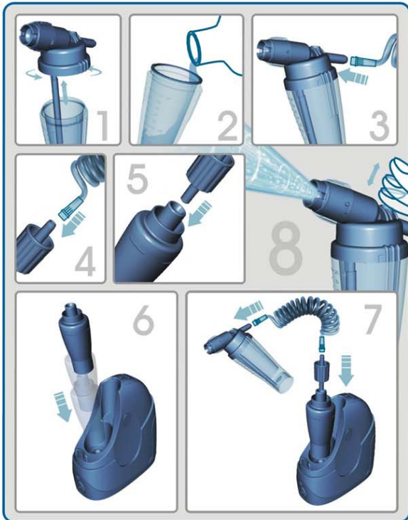
噴鼻組：操作與清潔